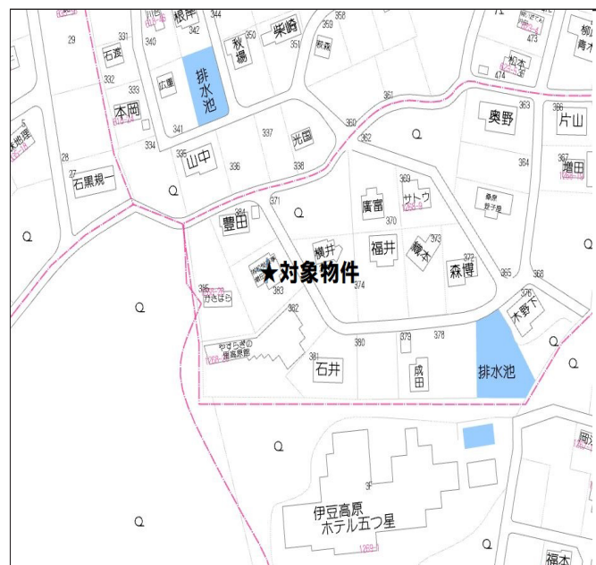
ゼンリン P113 B-4