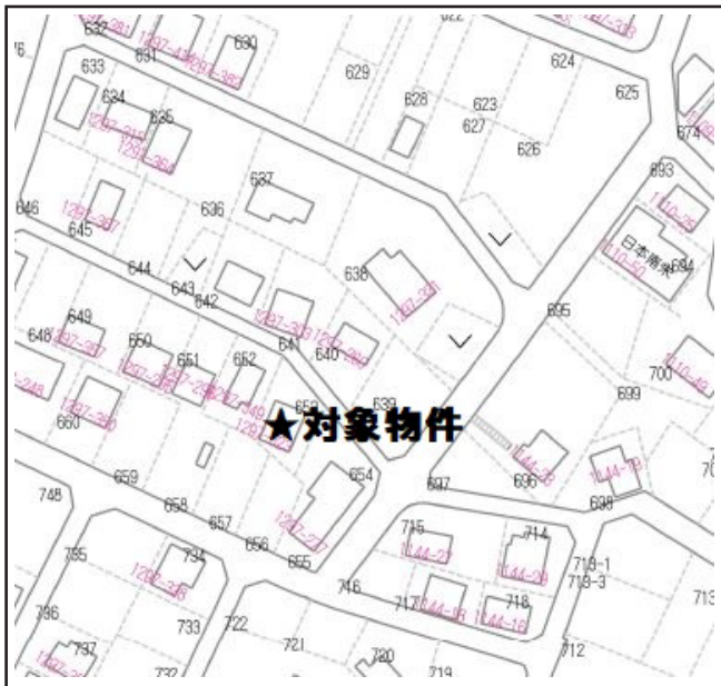
ゼンリン P56 D-1