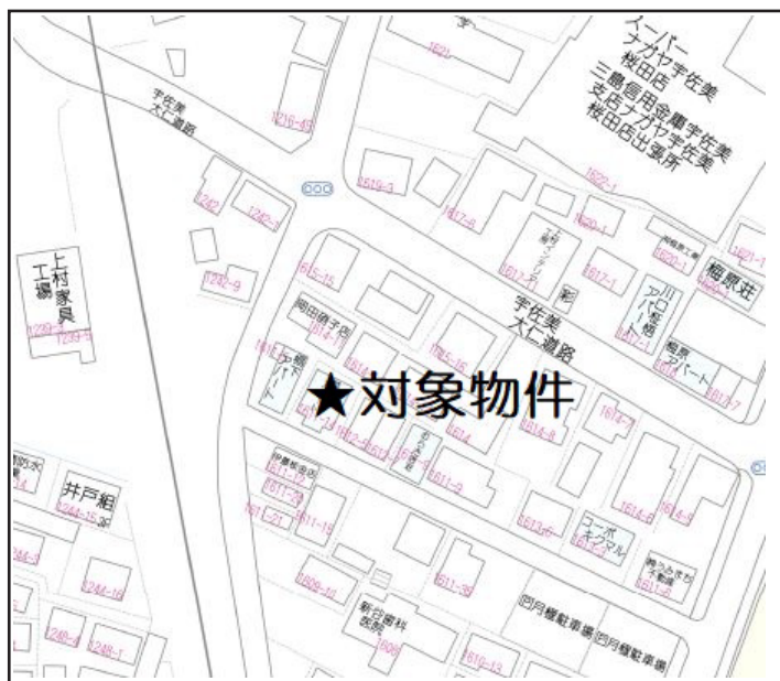
ゼンリン P15 J-2